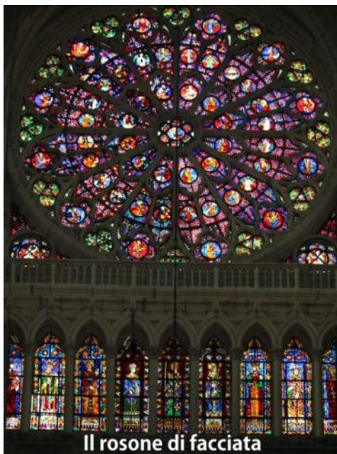
Il rosone di facciata

Dopodiché, in libera scelta, abbiamo visitato la cattedrale "Notre Dame", costruita agli inizi del XII secolo, essa è considerata come la maggiore espressione dell'arte gotica francese ed in quanto statuaria, conta la bellezza di 2.303 statue, la più ammirata è quella rappresen-