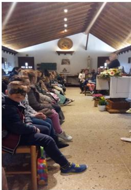
(Les enfants dans la chapelle)