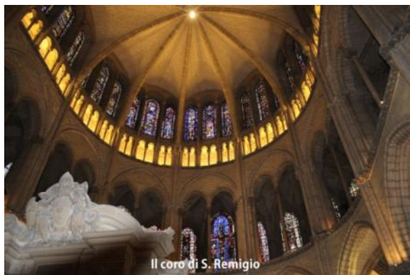
Il coro di S. Remigio