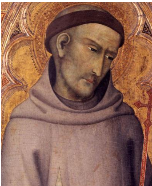
ANDREA VANNI, Ritratto di San Francesco

Di che, fatta la mattina, chiamò santo Francesco e disse così: "Frate Francesco, io ho al tutto disposto nel cuore mio d'abbandonare il mondo e seguitare te in ciò che tu mi comanderai". Udeno questo, santo Francesco si rallegrò in ispirito e disse così: "Messere Bernardo, questo che voi dite è opera sì grande e malagevole, che di ciò si vuole richiedere consiglio al nostro Signore Gesù Cristo e pregarlo che gli piaccia di mostrarci sopra a ciò la sua volontà ed insegnarci come questo noi possiamo mettere in