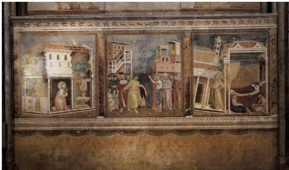
In copertina: GIOTTO, Miracolo del Crocifisso

La Pregiera in San Damiano o Miracolo del Crocifisso è la quarta delle ventotto scene del ciclo di affreschi delle Storie di san Francesco della Basilica superiore di Assisi, attribuiti a Giotto. Fu dipinta verosimilmente tra il 1295 e il 1299 e misura 230x270 cm.