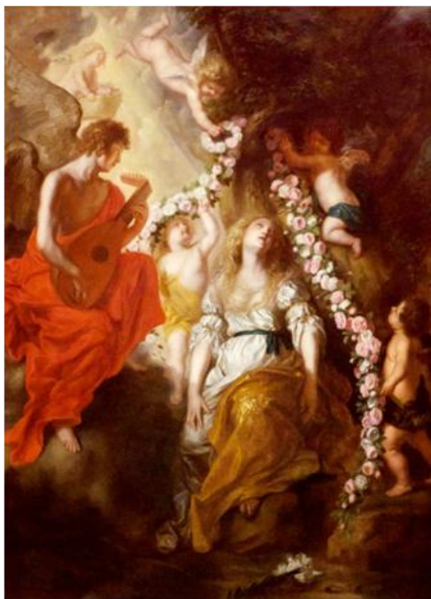
L'estasi di Santa Rosalia - Theodor Boeyermans / Beaux Arts -

La festa di Santa Rosalia chiamata " festino " si celebra per tre giorni a partire dal 15 luglio, dove, per le strade infiorate, punte da artistici fuochi pirotecnici la statua della santa, viene trainata solennemente su un imponente ed artistico carro, come i siciliani sanno fare, nonché, con immensa partecipazione di fedeli. Quanto al calendario cattolico, la festeggia il 4 settembre col titolo di "Santa Rosalia Vergine". Questo 2017 ricorreva la 393/a edizione, con una partecipazione di pubblico stimato a 300.000 persone circa.